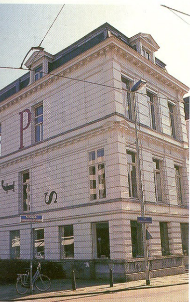
Bureau STRIJKERS Van Vollenhovenstraat 36-40 (010) 273.31.58